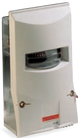
Détecteur de défaut directionnel aérien CRIX A11