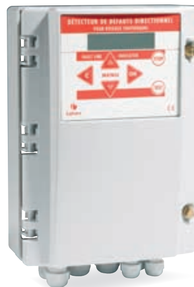
Détecteur de défaut directionnel souterrain CRIX S21