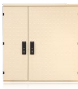
Armoire Eclairage Public vide (2 compartiments) Réf. 0460.531