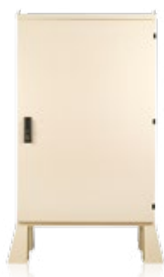
Armoire de chantier vide Réf. 0460.507