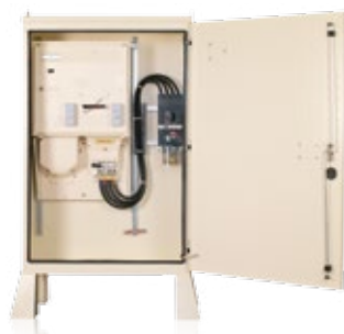
Armoire de chantier équipée Réf. 0710.202