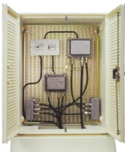
Armoire grande Réf. 0802202