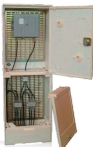
Borne moyenne Réf. 0802203