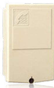
Borne de facade Réf. 0460008