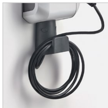
Support pour câble de recharge Réf. 13P2750322