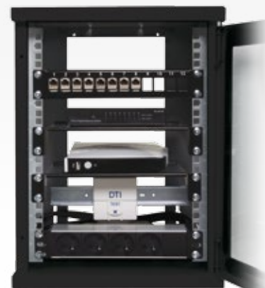
PACK 10" NOIR Ref 13P1553201