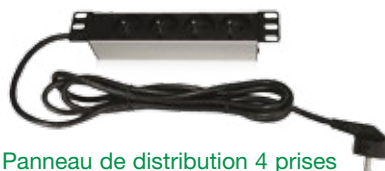
Panneau de distribution 4 prises PDU 4 plugs Ref. 13P1560017