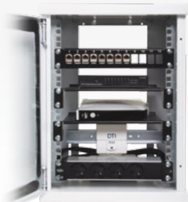
PACK 10" BLANC Ref 13P1553200

CAHORS propose 2 packs prêt à l'emploi pour vous faciliter les installations : CAHORS offers 2 packs ready to use :