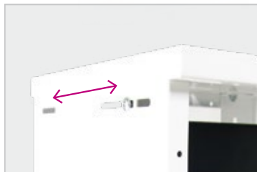
Réglettes modulables avant/arrière Frame adjustment