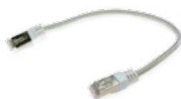
Cordon Cat.6 FTP / Cord Ref. 13P1510701