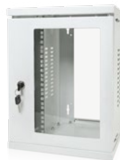
Coffret 10" blanc Réf. 13P1553006