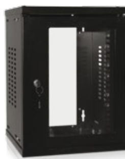
Coffret 10" noir Réf. 13P1553000