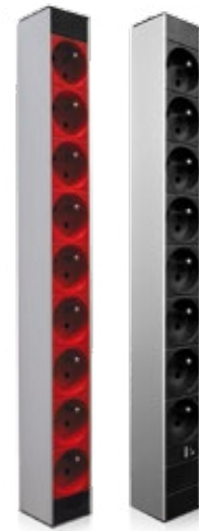
PDU 8PC 2P+T