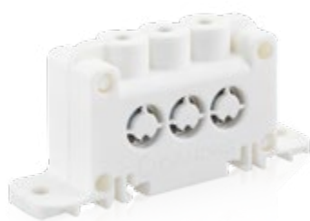
Répartiteur 3x35mm 2 Réf. 0934.003R13

Protection IP2X intégrale. Vis imperdables. Fixation sur Rail DIN ou support rigide.